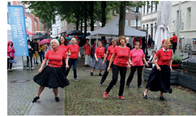
Seite 10 LineDance in Gerresheim