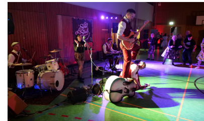
Seite 12 Magic Moments