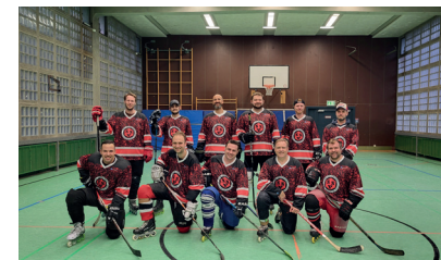
Seite 14 Skaterhockey