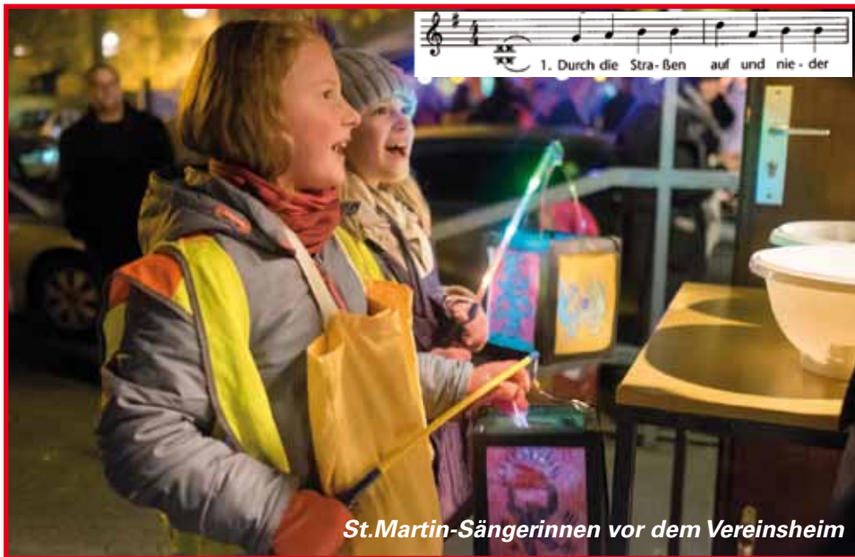
St.Martin-Sängerinnen vor dem Vereinsheim